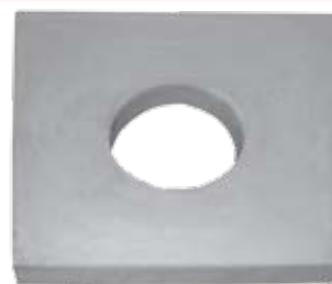
okorovaná deska KD