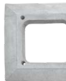
Plášťová tvárnice UN (výška 250 mm)